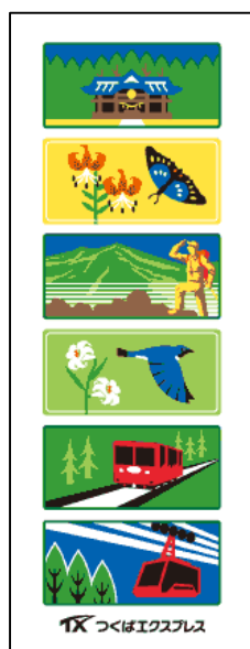
「オリジナル手ぬぐい」