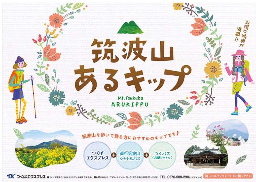
「筑波山あるキップ」列車内中吊りポスター (イメージ)

是非とも、今年の夏休みには『筑波山あるキップ』で筑波山の魅力を存分にお楽しみください。詳細は、別紙のとおりです。