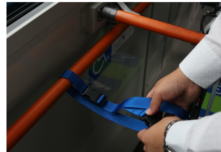
⑦降車の際は、バンドとラックは次回使う人のために元の位置にお戻し下さい。