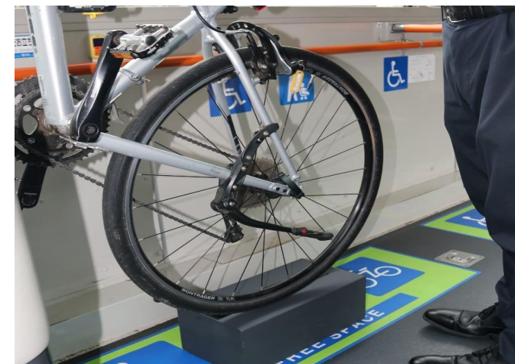
③後輪も同様にラックに装着します。