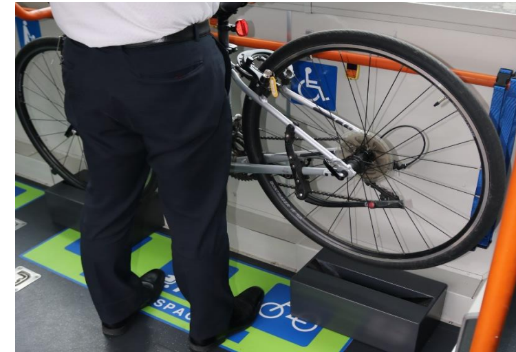
③後輪も同様にラックに装着します。