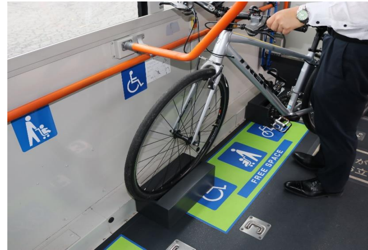
②前輪を持ち上げラックに装着します。