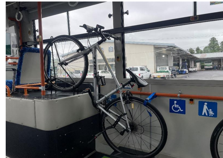
⑦振動で揺れないぐらいしっかり固定できれば完成です。