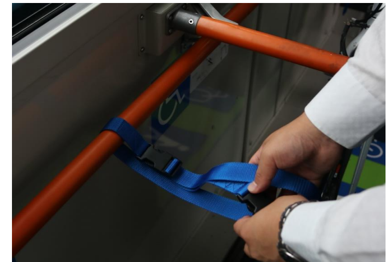
⑧降車の際は、バンドとラックは次回使う人のために元の位置にお戻し下さい。