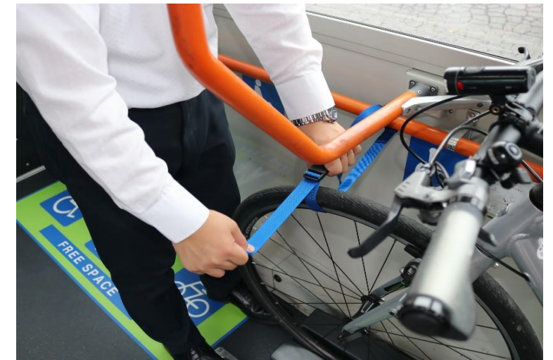
④前輪をバンドで固定します。この時しっかりと固定してください。