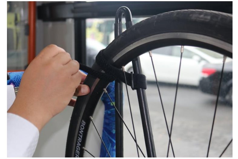
④前輪を上下2か所バンドで固定します。