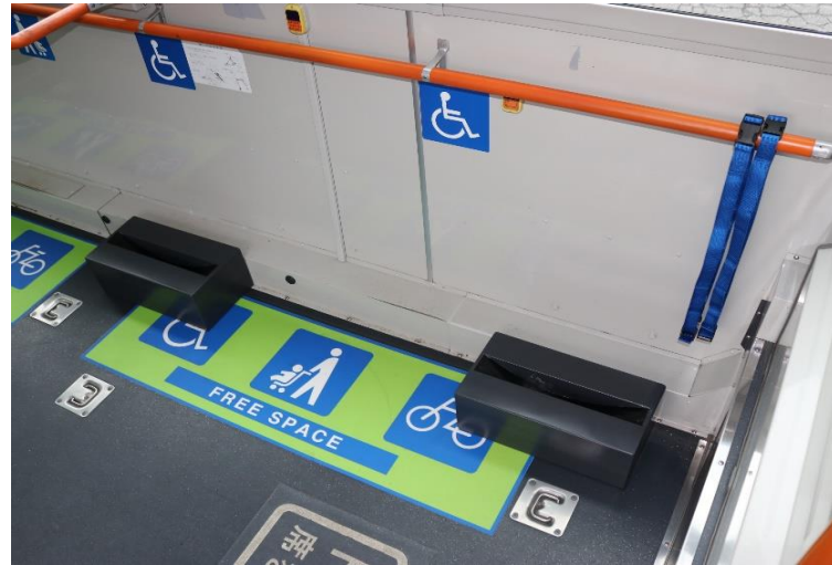
①床に後輪用のラックを設置します。