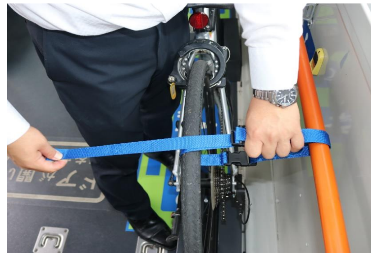
⑤後輪をバンドで固定します。この時しっかりと固定してください。