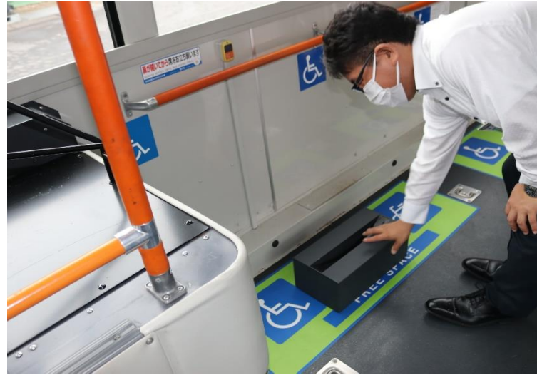
①床に後輪用のラックを設置します。