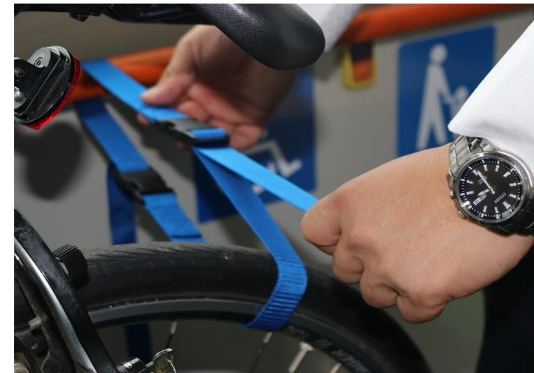
⑥手すりと後輪をバンドで固定します。この時しっかりと固定してください。