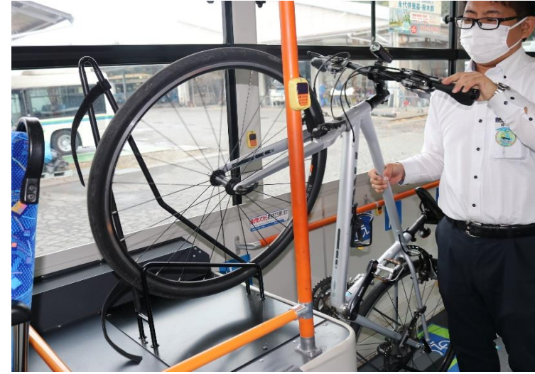
②前輪を持ち上げラックに装着します。