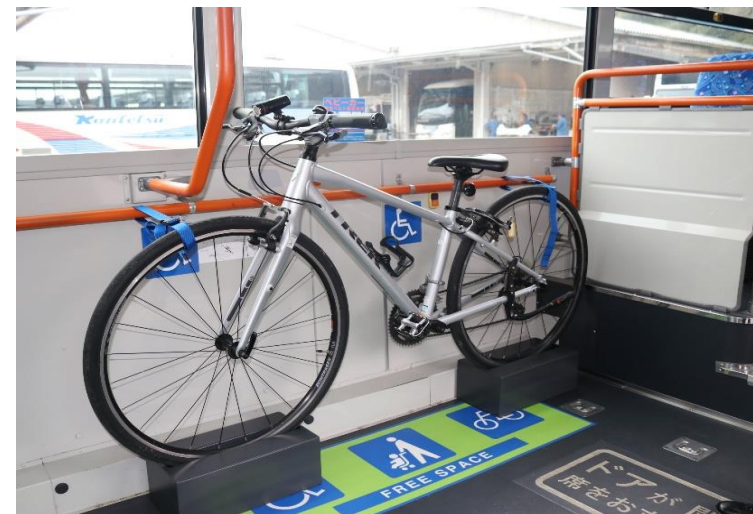
⑥振動で揺れないぐらいしっかり固定できれば完成です。