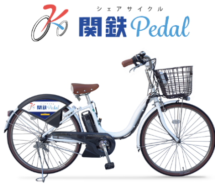
「関鉄 Pedal」電動アシスト自転車