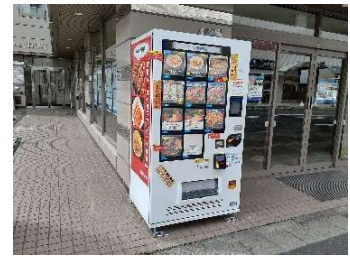
24時間購入できる 冷凍自販機「ど冷えもん」

関東鉄道株式会社（本社：茨城県土浦市 取締役社長：松上英一郎 以下「関東鉄道」）は、2023年10月6日（金）～2023年12月11日（月）、関東鉄道グループバス1日乗車券とシェアサイクル「関鉄Pedal」3,000円利用券が一体となった「関鉄グループバス・関鉄Pedal 1日乗車券」（以下本券）を3,000円で発売いたします。