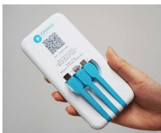
「モバイルバッテリー」