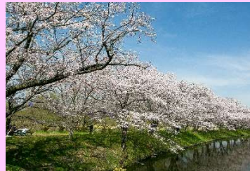
①福岡堰さくら公園② 福岡堰