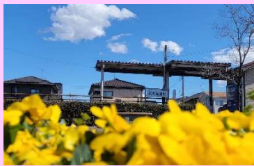
スタート北水海道駅