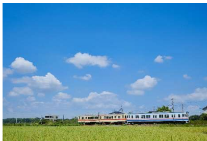
関東鉄道竜ヶ崎線