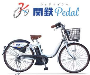
「関鉄 Pedal」電動アシスト自転車