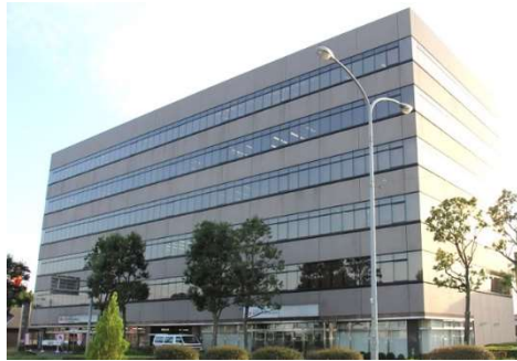
関鉄つくばビル 外観