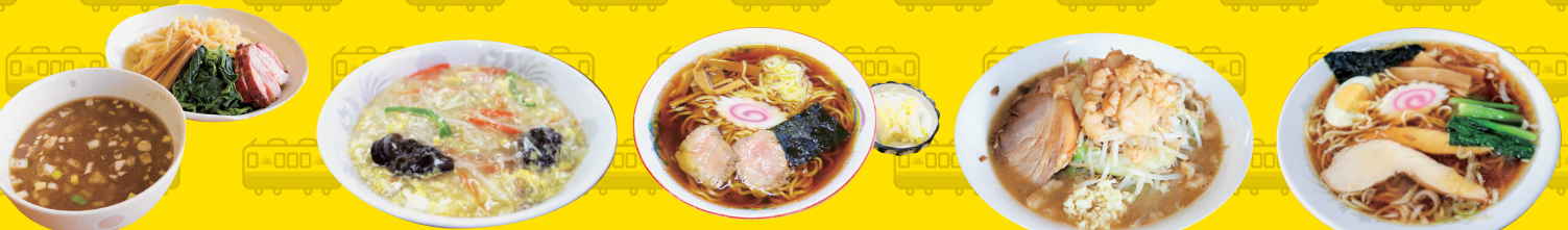
めんや 暁 下妻駅