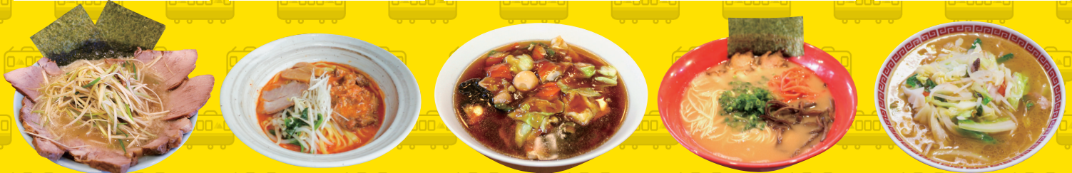
ラーメンショップ 新守谷店 新守谷駅