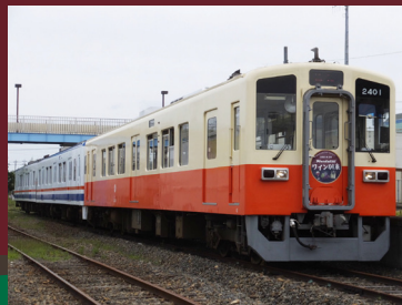
関東鉄道鉄道部 スズオくん

お申込み 関鉄観光(株) ワイン列車係 Tel 029-822-3727 (平日 9:00～17:30) ※キャンセル料については申込時にご説明いたします。