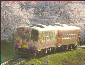
山形鉄道 ウサギ駅長もっちゃん