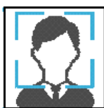
<顔認証による乗車>

NECソリューションイノベータ株式会社（顔認証システム） 一般社団法人ICTまちづくり共通プラットフォーム推進機構 （マイナンバーカードの公的個人認証サービス）と契約締結