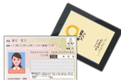
<マイナンバーカードによる乗車>

関東鉄道株式会社（茨城県土浦市）は、「つちうらMaaS実証実験」の実施にあたり、NECソリューションイノベータ株式会社（東京都江東区、以下NECソリューションイノベータ）と顔認証システムに関する契約を、一般社団法人ICTまちづくり共通プラットフォーム推進機構（群馬県前橋市、以下TOPIC）と、マイナンバーカードの個人認証サービスに関する契約をそれぞれ締結しました。