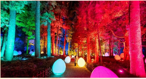
チームラボ（自立しつとも呼応する生命と呼応する大杉森）©チームラボ

臨時便は各種イベントの開催状況や新型コロナウイルスの感染状況により運行しない場合があります。最新情報はホームページでご案内します。