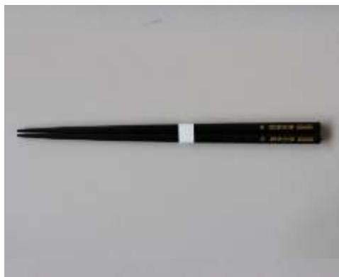
「関鉄オリジナル箸」