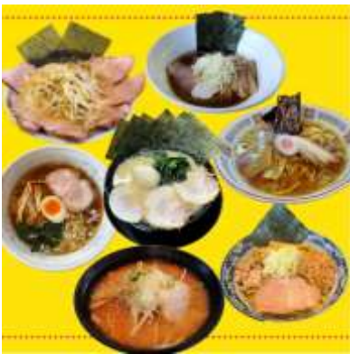
ラーメン（イメージ）