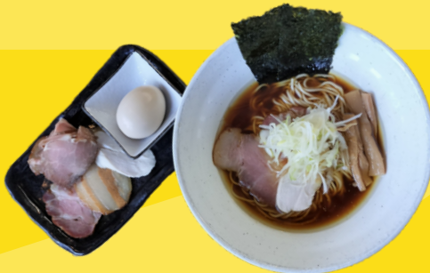
守谷駅 中華蕎麦 一魚庵 いちむあん