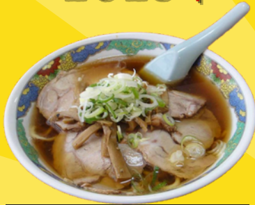
南守谷駅 手打らーめん 珍来軒