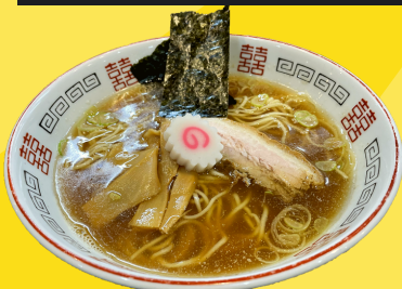
新守谷駅 麺処春の風