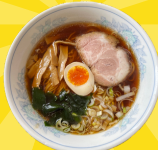
守谷駅 むらこ志家