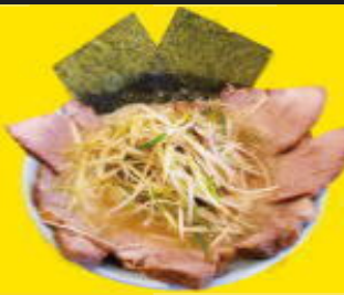
新守谷駅 ラーメンショップ 新守谷店