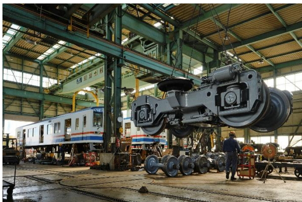
サックスの指導・コンサートを行う水海道車両基地工場棟