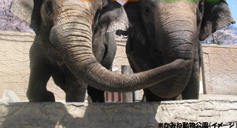
※かみね動物公園(イメージ)